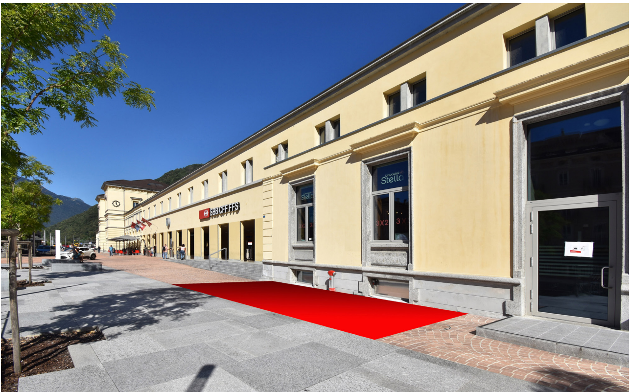
P1 Stand promozionale, piazzale della stazione 6 x 3 = 18 m 2